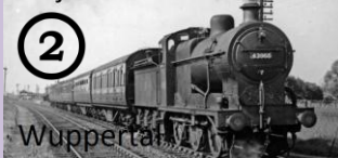
Wuppertal Via Barmen